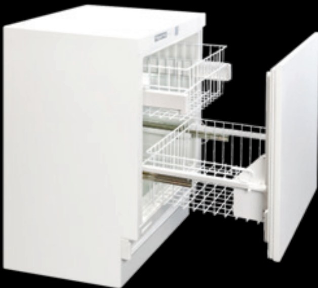
KM 140 FL 2