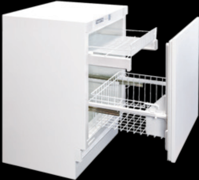
KM 140 FL

mit elektronischer Temperatursteuerung von 2°C bis 9°C